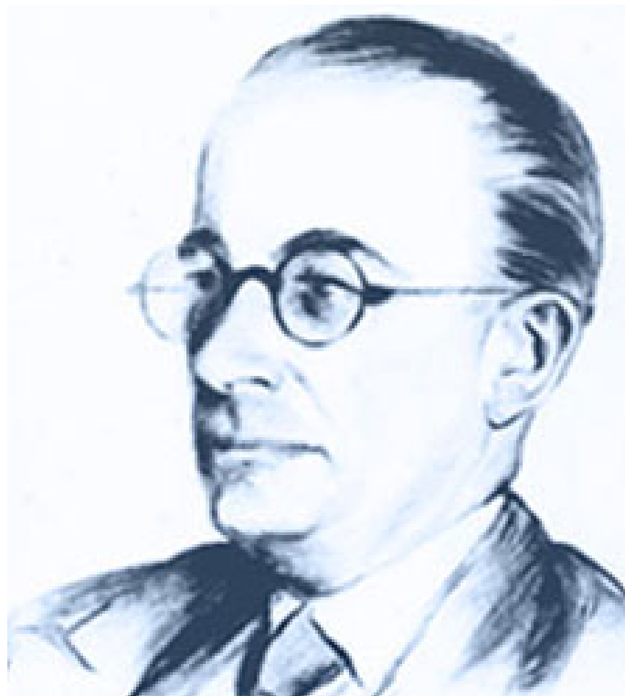
Manuel J. Bustamante de la Fuente

históricos mediante concursos a nivel nacional, los mismos que aún hoy se mantienen, habiéndose ampliado el ámbito de acción hacia los estudios socio-económicos. El doctor Bustamante de la Fuente falleció en Lima en 1978.